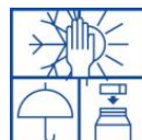
Vorstvrij, koel en droog opslaan. Verpakking goed sluiten